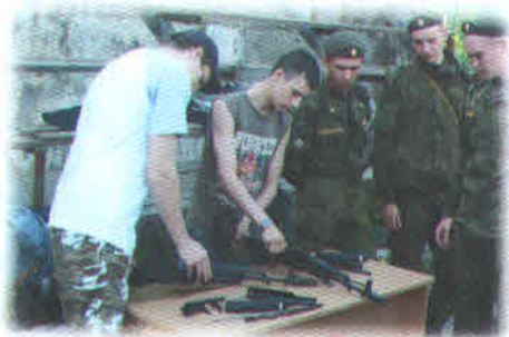
Ежегодно юноши участвуют в недельных военных сборах.