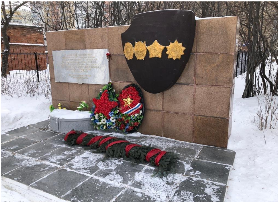
Обелиск у здания школы