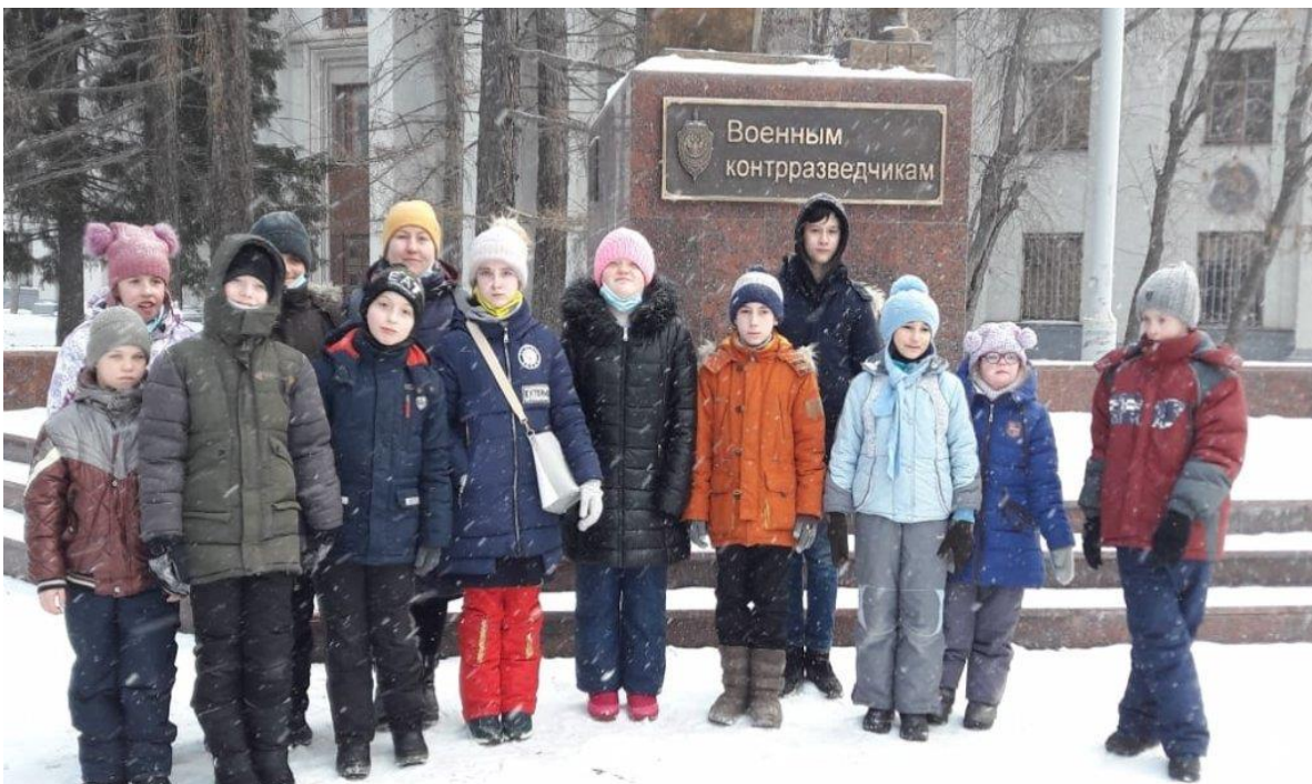
Экскурсия в Музей боевой славы Урала