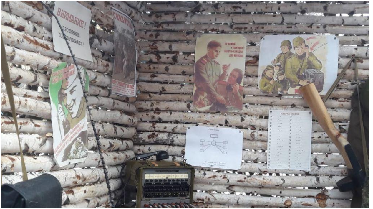
День защитника Отечества - 23 февраля(22.02.2022г.)