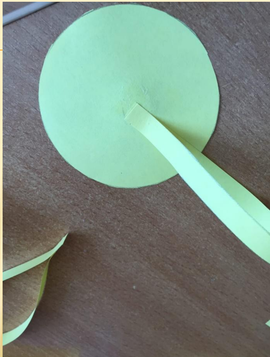
6. Наклеиваем полоски к кругу