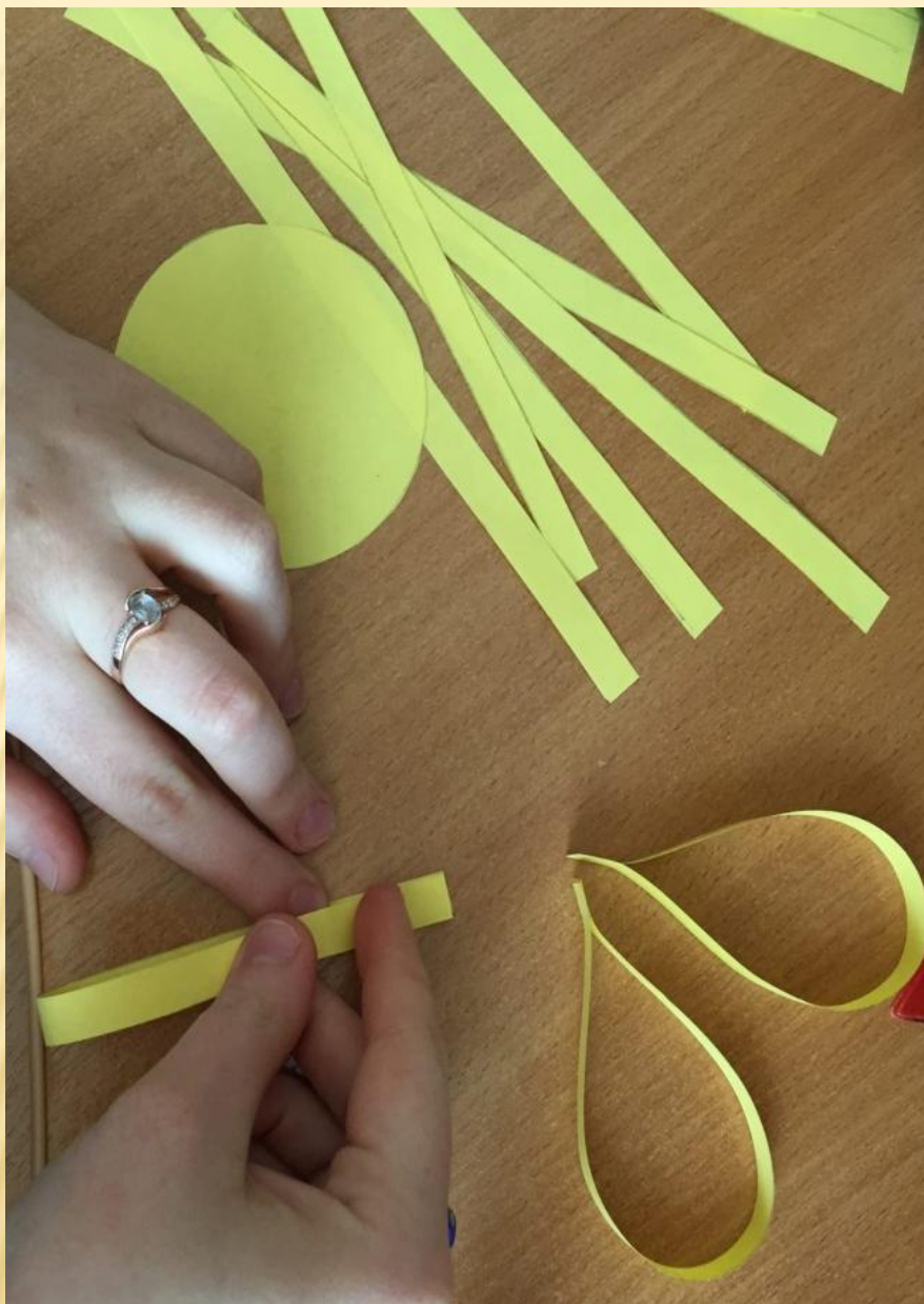
5. Склеиваем полоски только за край