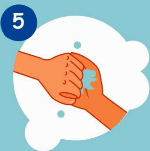
5 Моем пальчики с внешней стороны