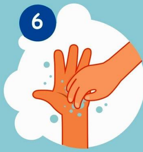
6 Трем ногти об ладонь