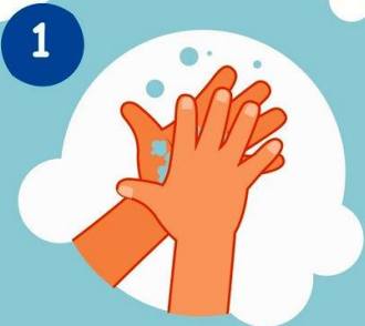
1 Ладонка об ладонку

СПРАВОЧНИК РУКОВОДИТЕЛЯ ДОШКОЛЬНОГО учреждения