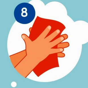
8 Смываем мыло, вытираемся насухо