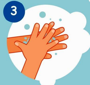
3 Тыльные стороны ладоней