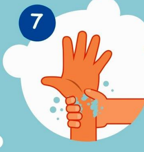
7 Моем запястья