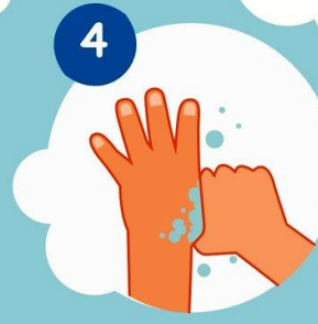
4 Моем пальчики