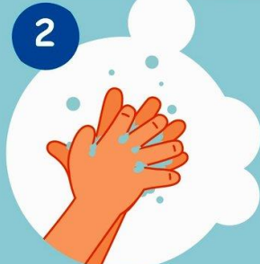
2 Между пальчиков