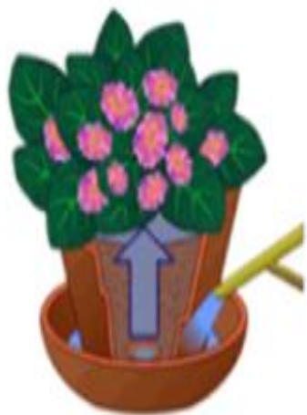
полив в поддон